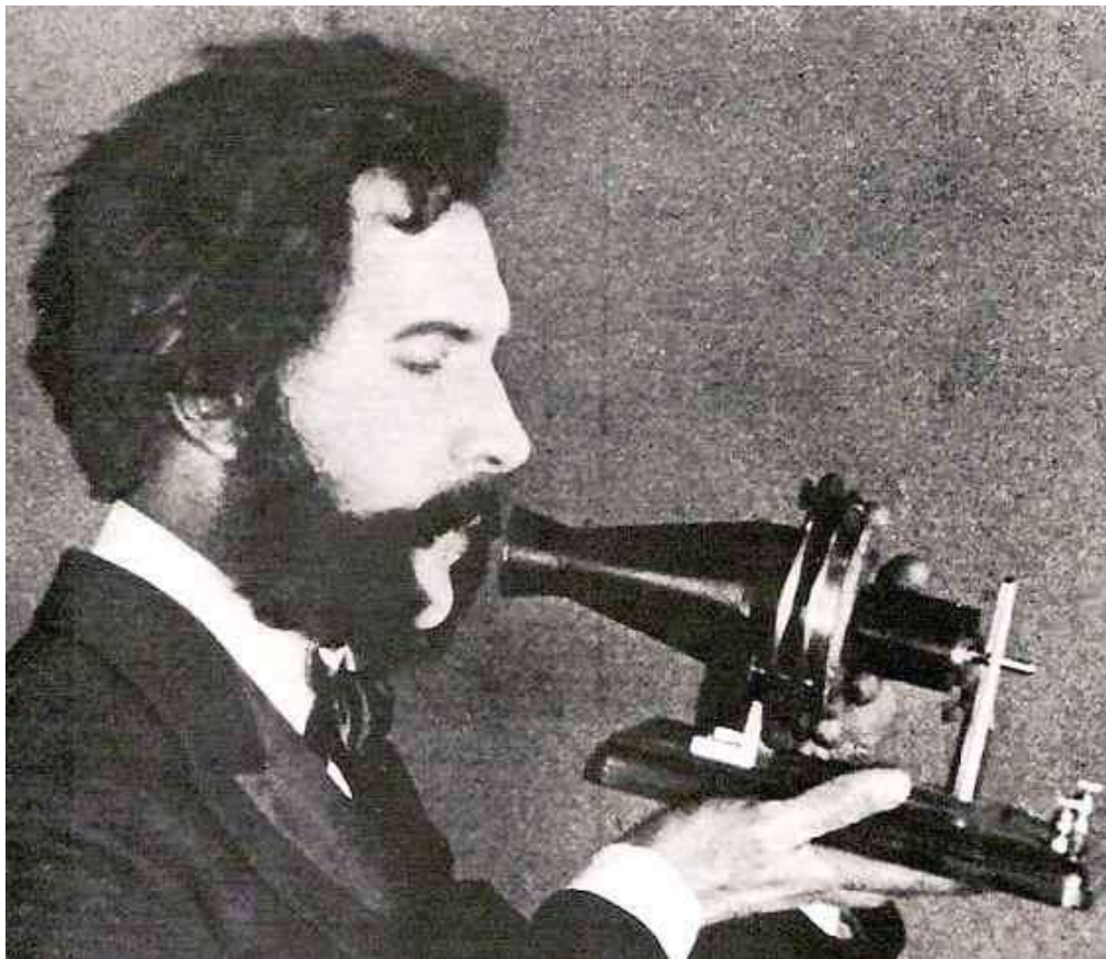
1876 r - Alexander Graham Bell, testuje prototyp telefonu