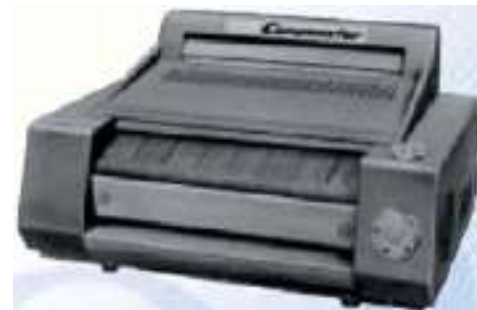
1960 r - Pierwsza kopiarka Copymaster