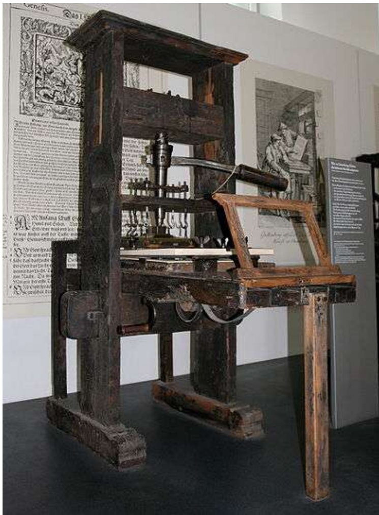
1811 r. - Prasa drukarska.