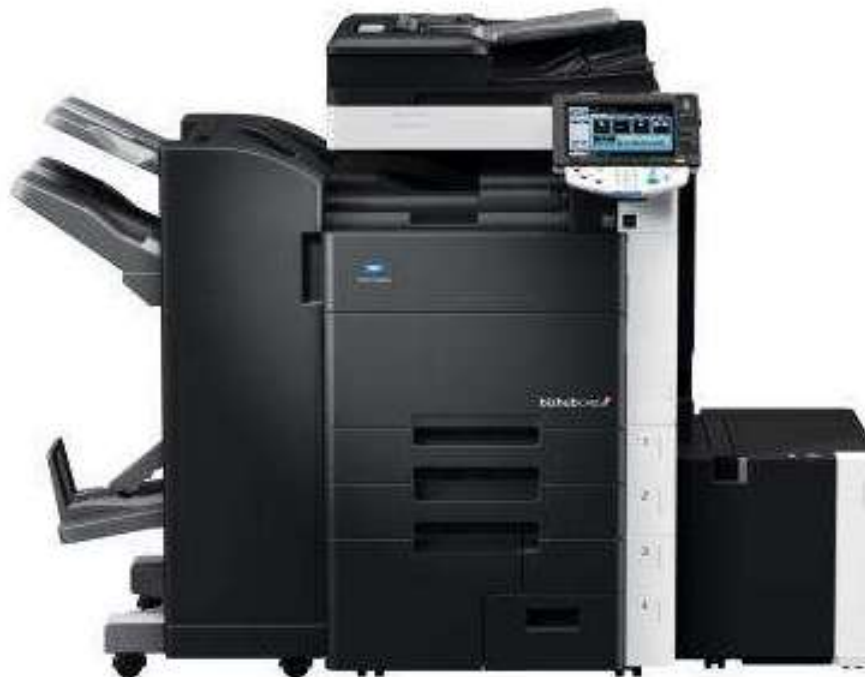
2011 r. - Urządzenie wielofunkcyjne Konica Minolta Bizhub C452